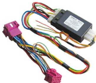
Рисунок 1. МАКС-2 Vesta

4.1 Модуль (рисунок 1) представляет собой электронное устройство, состоящее из управляющего микроконтроллера и силовых цепей коммутации нагрузки. Микроконтроллер по сигналу от охранной сигнализации или при нажатии кнопок управления стеклоподъёмниками включает и выключает электродвигатели стеклоподъёмников по заданному алгоритму.