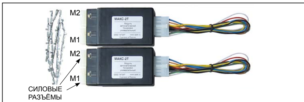
Рисунок 1. Комплект модулей МАКС-2Т 20А. Внешний вид

управляет «светлым» стеклом, второй — «тёмным». Также через силовые разъёмы к Модулю подключаются линия питания (постоянные +12 В) и масса.