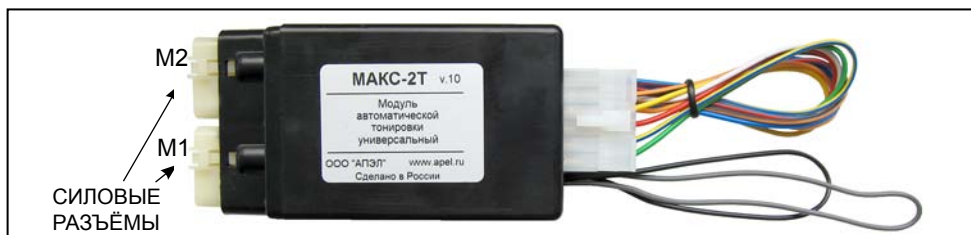
Рисунок 1. Модуль МАКС-2Т 20А. Внешний вид

управляет «светлым» стеклом, второй – «тёмным». Также через силовые разъёмы к Модулю подключаются линия питания (постоянные +12 В) и масса.