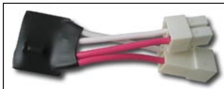
Рисунок 1. Регулятор пуска вентилятора РПВ

4.1 Регулятор рис. 1 представляет собой электронное устройство состоящее из управляющего микроконтроллера и цепи регулирования нагрузки. Микроконтроллер по заданной программе плавно включает нагрузку.