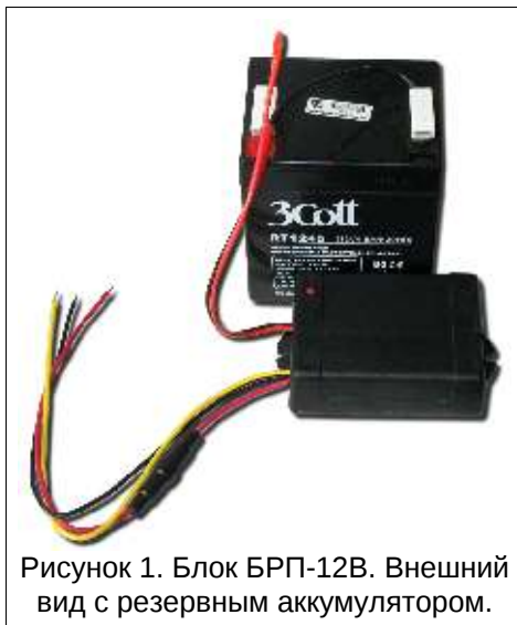
Рисунок 1. Блок БРП-12В. Внешний вид с резервным аккумулятором.

При снижении напряжения кислотного аккумулятора ниже определённого уровня в нём происходят необратимые изменения которые резко снижают его ёмкость, вплоть до полного выхода из строя. Поэтому блок постоянно контролирует сте-